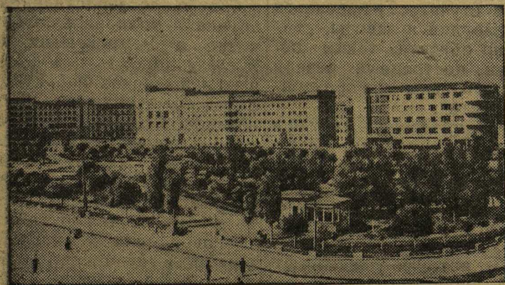
Площадь имени павших бойцов в Сталинграде.