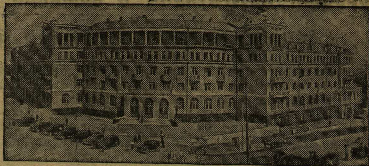
Вновь выстроенная центральная гостиница на улице имени Ленина в гор. Кирове.